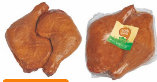
КОПЧЕНИЕ НА БУКОВОЙ ЩЕПЕ