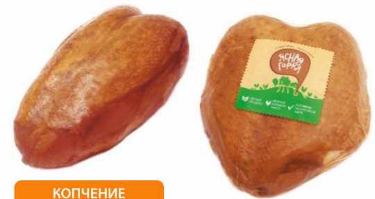
КОПЧЕНИЕ НА БУКОВОЙ ЩЕПЕ