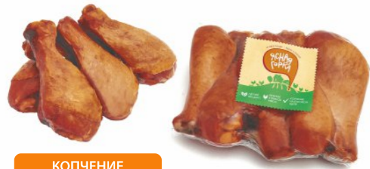
КОПЧЕНИЕ НА БУКОВОЙ ЩЕПЕ