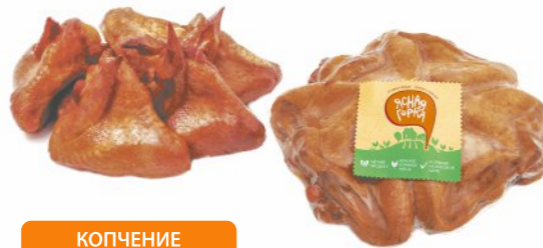
КОПЧЕНИЕ НА БУКОВОЙ ЩЕПЕ